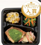
こだわりの おいしさ