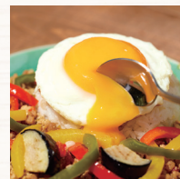
ボリューム 大幅アップ ※プチデリカ比 1.7倍