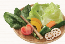
食物繊維 10.2g以上 ※おかず 6.6g、もち麦ごはん 3.6g以上