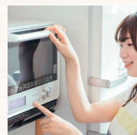
調理の手間なし カンタン♪