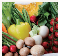
こだわりの 国産食材