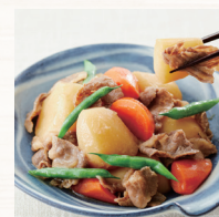
おいしさ そのまま