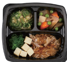
そよ風のやさしい食感