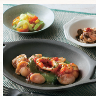
メニュー豊富 30種類