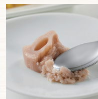
歯茎でつぶせる やわらかさ