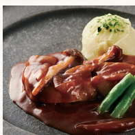
さらにおいしく リニューアル