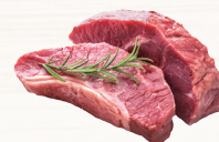
たんぱく質 22.6g以上 ※おかず 18.0g、もち麦ごはん 4.6g以上